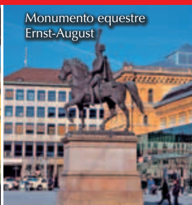
Monumento equestre Ernst-August